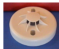
Внешний вид извещателя

Россия, 390023, г.Рязань, пр. Яблочкова, 5, корпус 1 Тел. (4912) 24-92-15 Тел./факс (4912) 45-66-48 E-mail: strag@kss.ryazan.ru http://www.kss.ryazan.ru